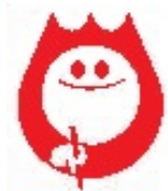
いきいき県民カレッジスタンプ印影