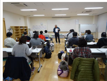
【平成27年度の講習会の様子】

注: 受講が許可されるためには、新潟県教育委員会の推薦が必要です。県立生涯学習推進センターに必要書類を提出していただければ、当センターから新潟県教育委員会に推薦の依頼をいたします。