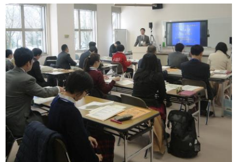
平成28年度の講習会の様子

注: 受講が許可されるためには、新潟県教育委員会の推薦が必要です。県立生涯学習推進センターに必要書類を提出していただければ、当センターから新潟県教育委員会に推薦の依頼をいたします。