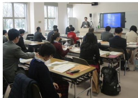
平成28年度の講習会の様子

注: 受講が許可されるためには、新潟県教育委員会の推薦が必要です。県立生涯学習推進センターに必要書類を提出していただければ、当センターから新潟県教育委員会に推薦の依頼をいたします。