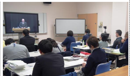
平成29年度の講習の様子

注: 受講が許可されるためには、新潟県教育委員会の推薦が必要です。県立生涯学習推進センターに必要書類を提出していただければ、当センターから新潟県教育委員会に推薦の依頼をいたします。