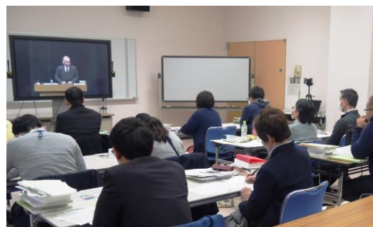
平成29年度の講習の様子

注: 受講が許可されるためには、新潟県教育委員会の推薦が必要です。県立生涯学習推進センターに必要書類を提出していただければ、当センターから新潟県教育委員会に推薦の依頼をいたします。