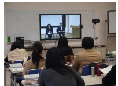
平成30年度の講習の様子

注：受講が許可されるためには、新潟県教育委員会の推薦が必要です。県立生涯学習推進センターに必要書類を提出していただければ、当センターから新潟県教育委員会に推薦の依頼をいたします。