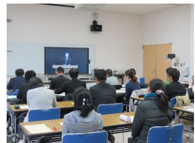
令和元年度の講習の様子

注：受講が許可されるためには、新潟県教育委員会の推薦が必要です。県立生涯学習推進センターに必要書類を提出していただければ、当センターから新潟県教育委員会に推薦の依頼をいたします。