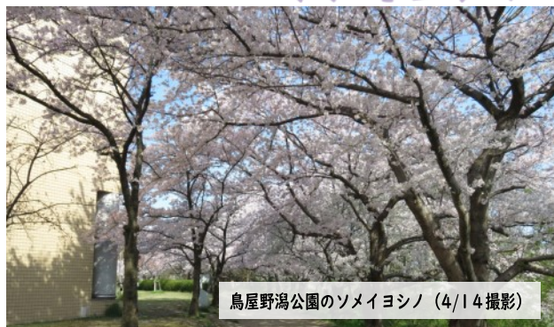
鳥屋野潟公園のソメイヨシノ（4/14撮影）