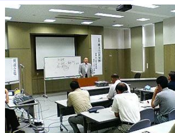
(昨年度の講座の様子)

講師のいる主会場と県内の各会場をテレビ電話システムで結ぶ双方向性を活かした広域遠隔学習「にいがた連携公開講座2006」の計画が決定しました。今年度は9講座で開催されます。県立生涯学習推進センターでは、第1回の7月8日（土）を除き8講座を受講できますが、その他の受信会場等についてはセンターまでお問い合わせください。