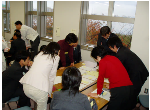
午後のワークショップ