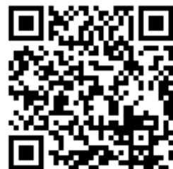
新潟県立生涯学習推進センター 「ラ・ラ・ネット」QRコード

これまで多くの県民の皆さまから参加していただき感謝申し上げます。 さて当センターの上映会は、令和6年度4月より映画ボランティアによる運営により、月に2回実施することとなりました。実施日は第2木曜日と第4日曜日です。 (5月は9日(木)実施) 上映回数が減ってしまい、毎回楽しみにされていた方にとっては残念なことですが、ご理解いただきますようよろしくお願いいたします。